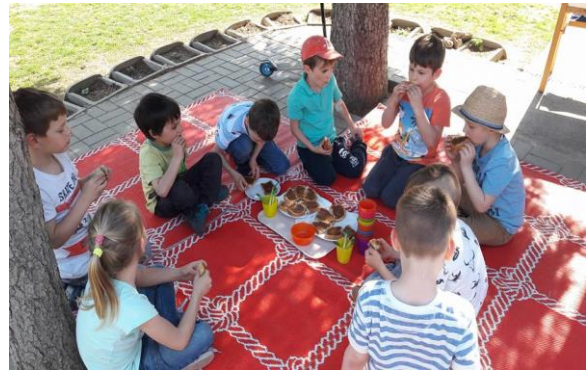
Uzsonna a szabadban