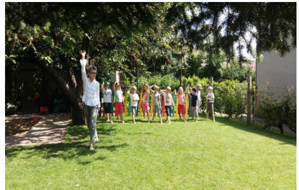
Mezítlábás torna a friss levegőn