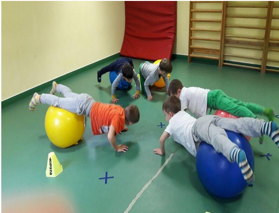
Testnevelés a tornaszobában