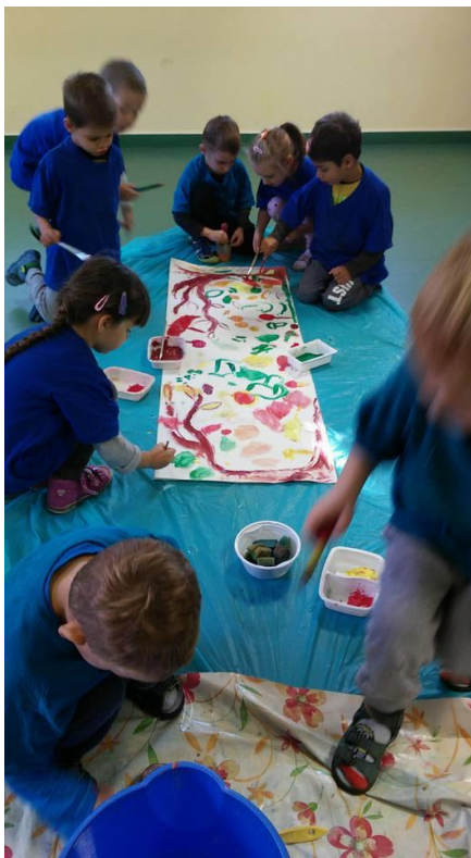
Közös őszi kép készítése