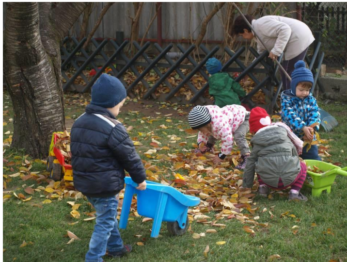
Őszi levelek összegereblyézése