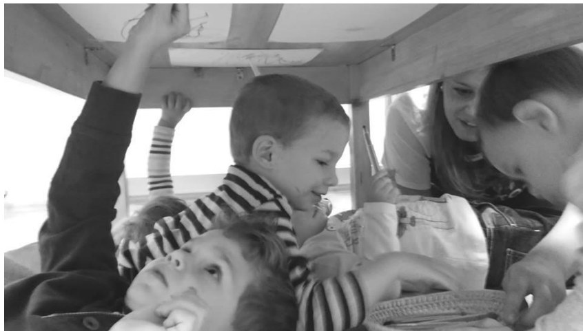
Rajzolás az asztal aljára felragasztott