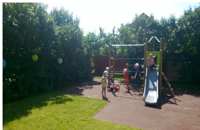
Telepített játszótér, ütészálló gumitéglával