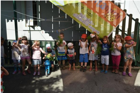
Répa és retekszüret után