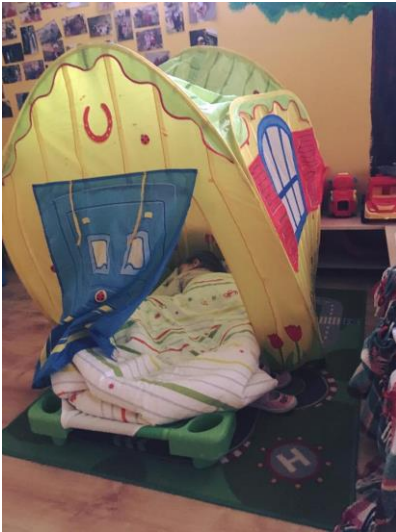
Pihenés a kuckóban