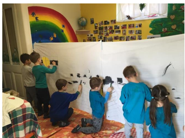
Vár festés lepedőre