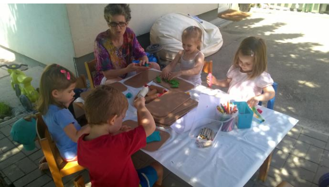
Vizuális nevelés a szabadban