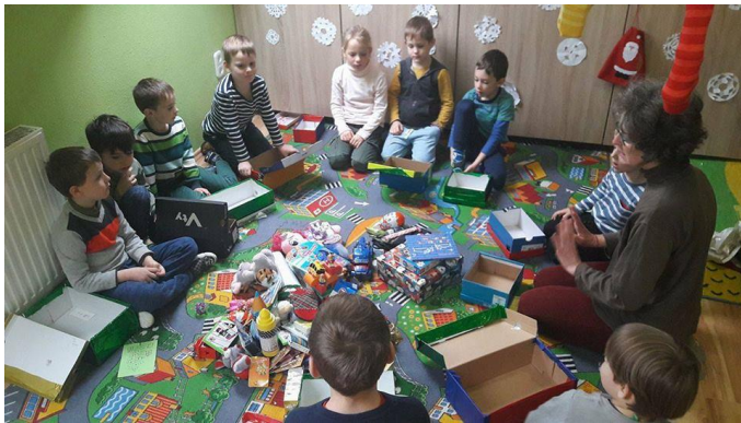
Gyermekek játékaikat a rászoruló gyerekeknek adják