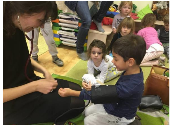
Doktor néni megméri a pulzusát