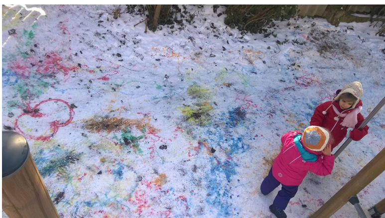
Festés a hóba