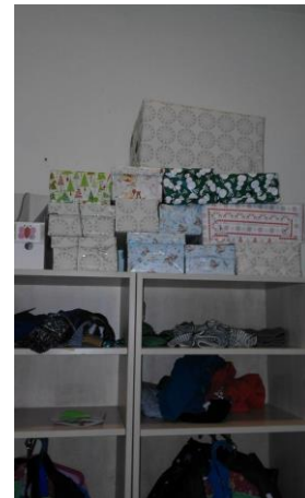
Kész cipős dobozok tele játékokkal