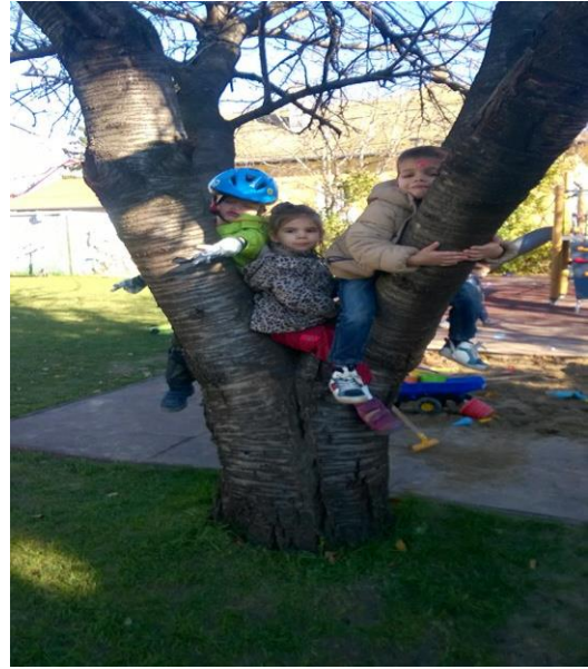
Az eső sem riaszt el minket az udvari játéktól.