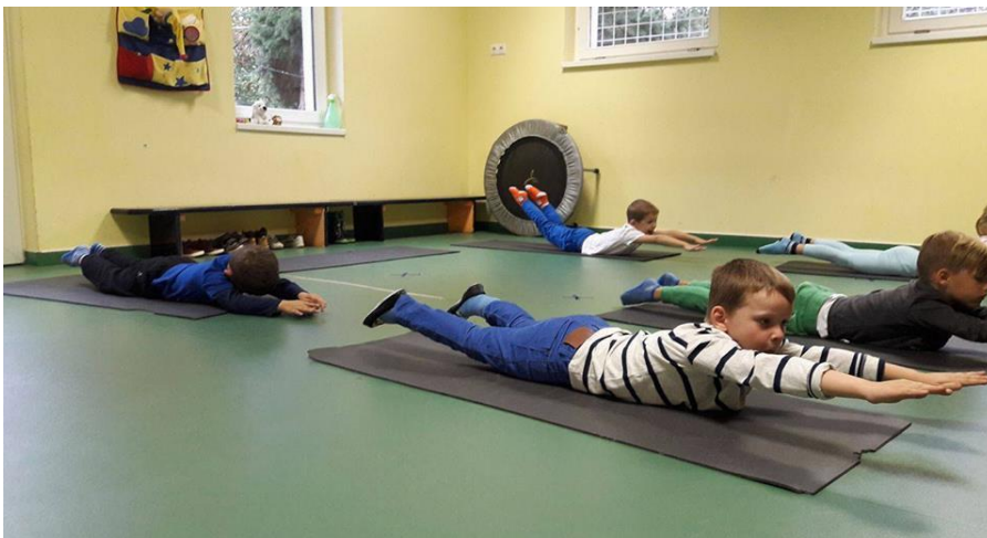
Testnevelés a tornaszobában

Az óvodában található egy jól felszerelt tornaszoba, mely minden igényt kielégít a gyermekek mozgásának fejlesztésére. A tornaszobában található sokféle mozgásfejlesztő eszköz és kellék, mely segíti a szervezett nagymozgásukat.