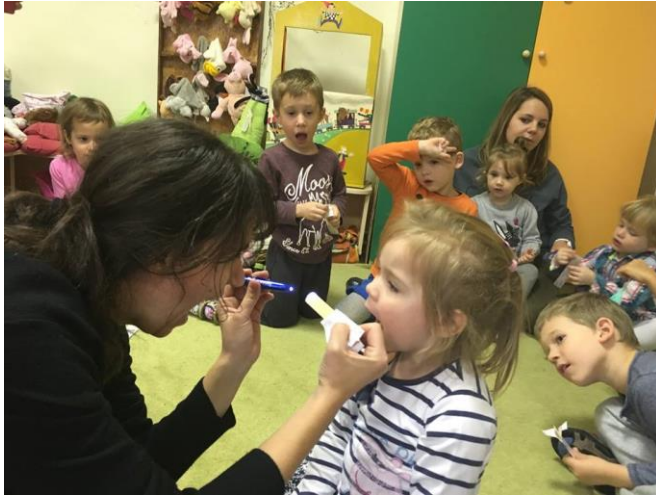
Doktor néni az óvodában

Óvoda-egészségügyi ellátás: orvos, védőnő ellátogatása, fogorvosi szűrés