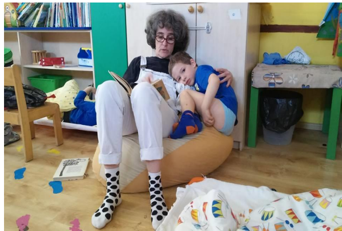
Mesehallgatás óvó néni

Betegségek észlelése (orvos, szülő értesítése, gyermek elkülönítése, gyógyszer nem adhatunk)