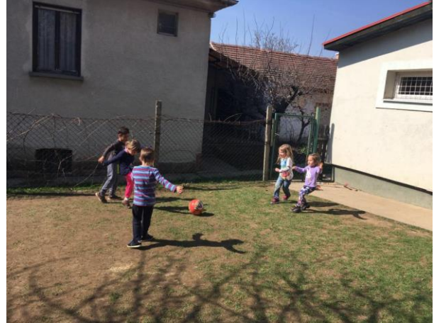
Mozgásos játékok helye