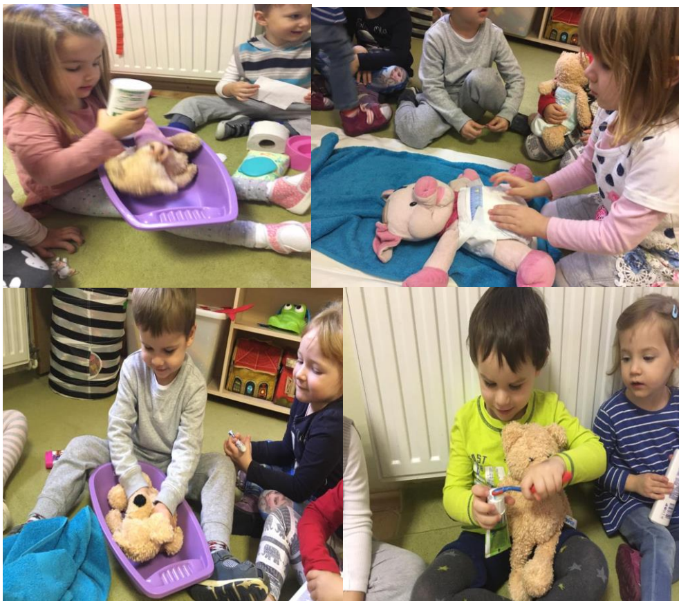
Tisztálkodás hét- Mackó gondozása