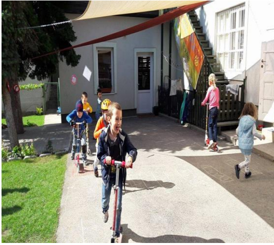
Bicikli, roller, motorpálya