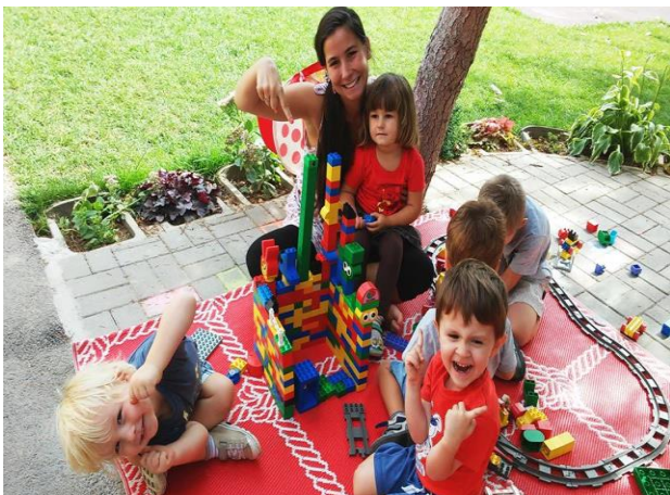
Nyári Duplózás az udvaron