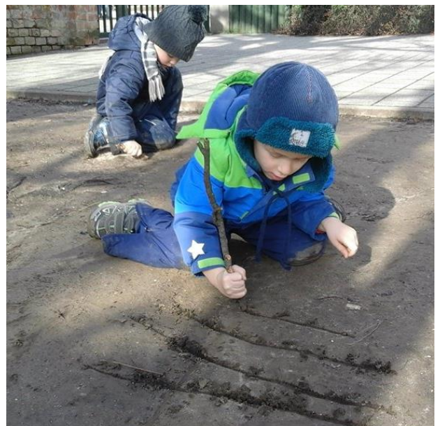
Földre rajzolás faággal