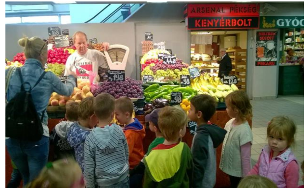
Fehérvári úti vásárcsarnokban