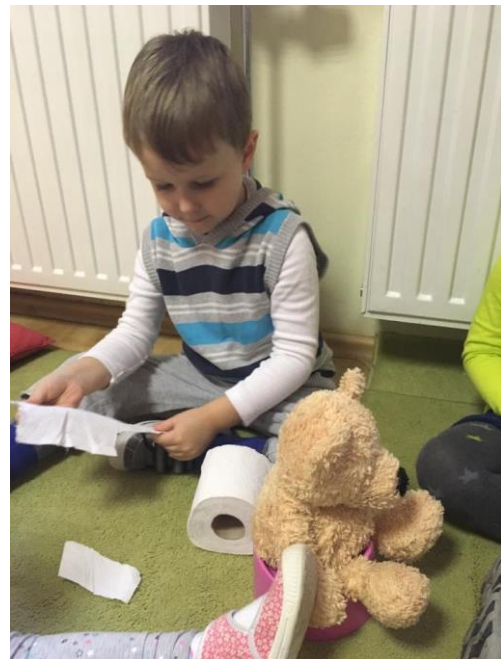
Higiéniai szokások gyakorlása játékosan