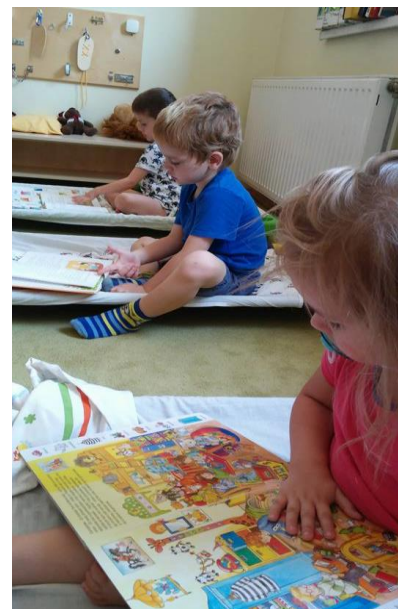
Pihenés előtti könyvnezegetés

A gyermekeknek szükségük van a délutáni pihenésre. Előtte megfelelően kiszellőztetünk, majd biztosítjuk a nyugodt pihenés feltételeit. A gyermekek csendben alvósaikkal alhatnak. Pihenés előtt mindig mesélünk, énekelünk, halk zenét hallgatunk, simogatjuk őket és hozzájuk bújunk. A gyerek akkor aludt eleget, ha keltés nélkül ébred. Az alvást már kevésbé igénylők számára, egy óra után csendes tevékenységeket biztosítunk.